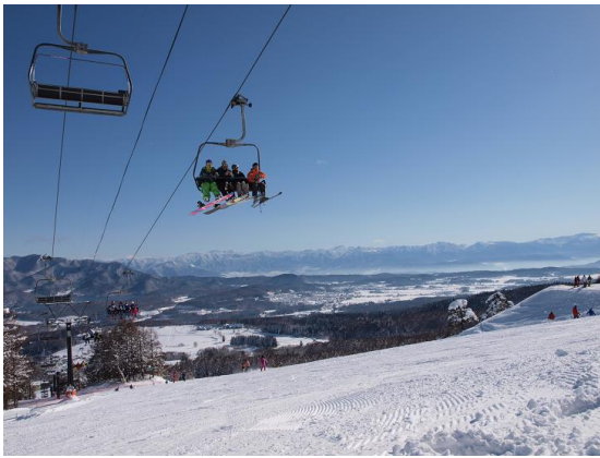
志賀高原の山々を望みながら広いゲレンデを気持ちよく滑走が楽しめます (黒姫第1クワッドリフト沿線コース)