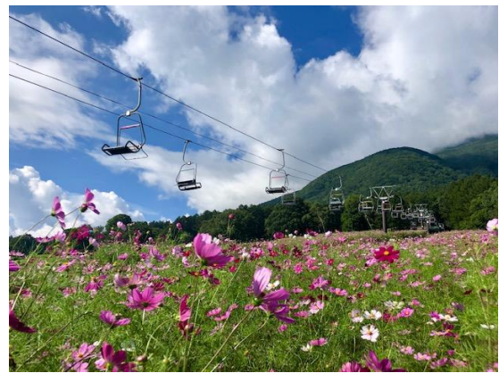
コスモス空中散歩と北信五岳が楽しめるパノラマリフト (第3ペアリフト)