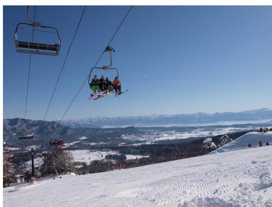
志賀高原の山々を望みながら広いゲレンデを気持ちよく滑走が楽しめます (黒姫第1クワッドリフト沿線コース)