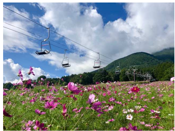
コスモス空中散歩と北信五岳が楽しめるパノラマリフト (第3ペアリフト)