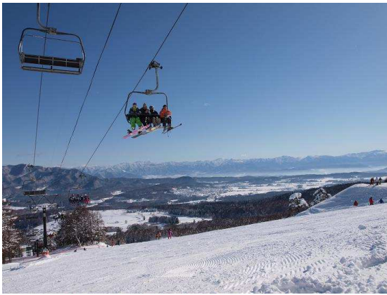
志賀高原の山々を望みながら広いゲレンデを気持ちよく滑走が楽しめます (黒姫第1クワッドリフト沿線コース)