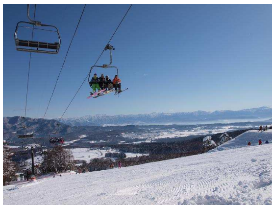
志賀高原の山々を望みながら広いゲレンデを気持ちよく滑走が楽しめます（黒姫第1クワッドリフト沿線コース）