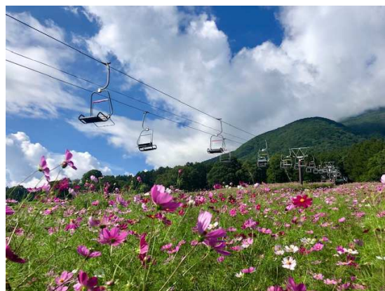
コスモス・ダリア空中散歩と北信五岳が楽しめるパノラマリフト（第3ペアリフト）